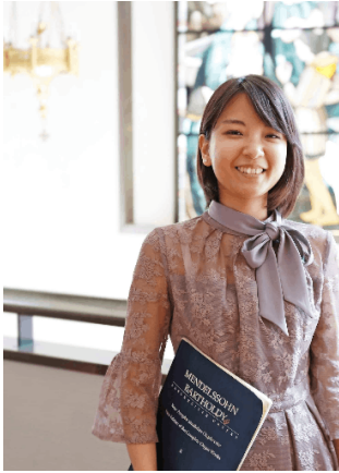
笑方箋 (2019年9月、九州の医大生で結成された3MCのポップグループ)